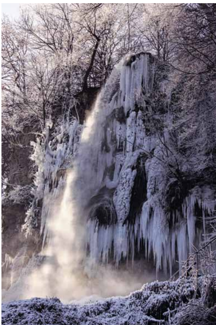
In frostigem Zauber – der Uracher Wasserfall