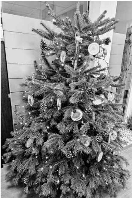
Geschmückter Weihnachtsbaum in der Volksbank Dettingen

Bereits Mitte November begannen unsere Weihnachtsvorbereitungen. Die Kinder bastelten die Deko für den Weihnachtsbaum in der Dettinger Filiale der Volksbank. Über mehrere Tage wurden Holzscheiben bemalt und mit Glitzer verziert. Auch ein Paar Tannenzapfen wurden mit Glitzer und bunten Pompons gestaltet. Am Donnerstag den 27. November durften 10 Kinder die gebastelte Deko mitnehmen und in die Volksbank bringen. An der Volksbank angekommen wurden wir von einer netten Mitarbeiterin empfangen und begrüßt. Die Kinder konnten es kaum abwarten, den großen Tannenbaum zu schmücken. Schnell war die Arbeit erledigt und als kleines Dankeschön bekamen die Kinder einen kleinen Plüschesel und einen Schokoweihnachtsmann.