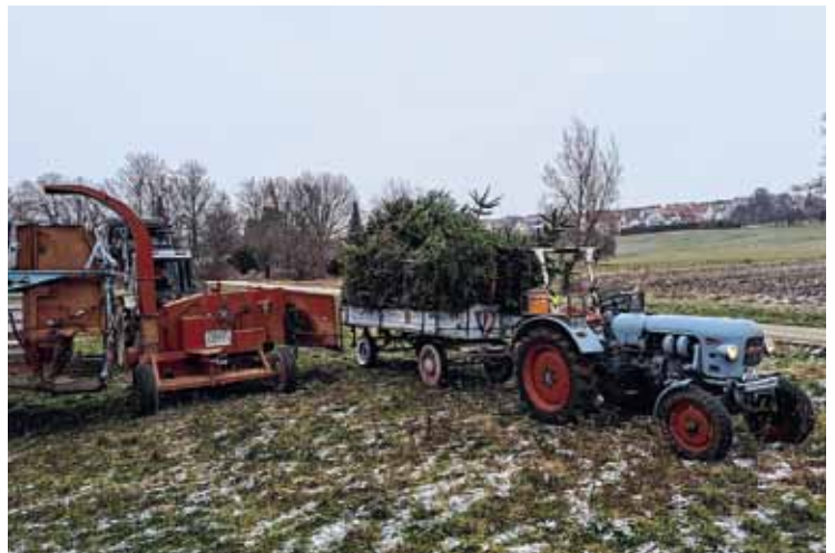
Am 10. Januar 2026 sammeln die Dettinger Pfadfinder*innen wieder die Christbäume in Dettingen ein und sammeln dabei Spenden für das Dettinger Projekt „KiTa für Alle“.