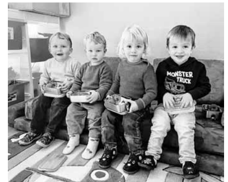
Bild: Erzieherinnen der Spielgruppe

Nachdem wir Weihnachtslieder gesungen und unsere Adventsgeschichte gehört hatten, haben wir in den Sack geschaut, den der Nikolaus für die Kinder der Spielgruppe dagelassen hat. Und siehe da, für jedes