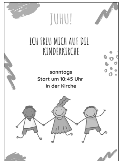
Plakat: Eva-Maria Braun via canva.com

Am Sonntag um 10.45 Uhr ist wieder Kinderkirche. Wir starten im Gottesdienst in der Kirche und gehen dann gemeinsam rüber. Ihr dürft euch auf eine spannende Geschichte, fetzige Lieder und vieles mehr freuen. Wir freuen uns, euch zu sehen! Gerne dürfen auch die Eltern dabei sein.