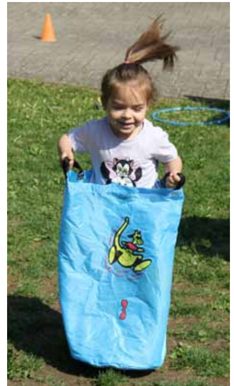
Mit großen Sprüngen beim Sackhüpfen.

Der Frühling zeigte sich von seiner schönsten Seite, als die Kita Regenbogen am Wochenende zu ihrem Frühlingsfest einlud. Im herrlichen Garten der Kita entstand schnell eine fröhliche und familiäre Atmosphäre. Kinder, Eltern, Großeltern und Gäste kamen zusammen, um gemeinsam zu spielen, zu lachen und den Vormittag zu genießen.