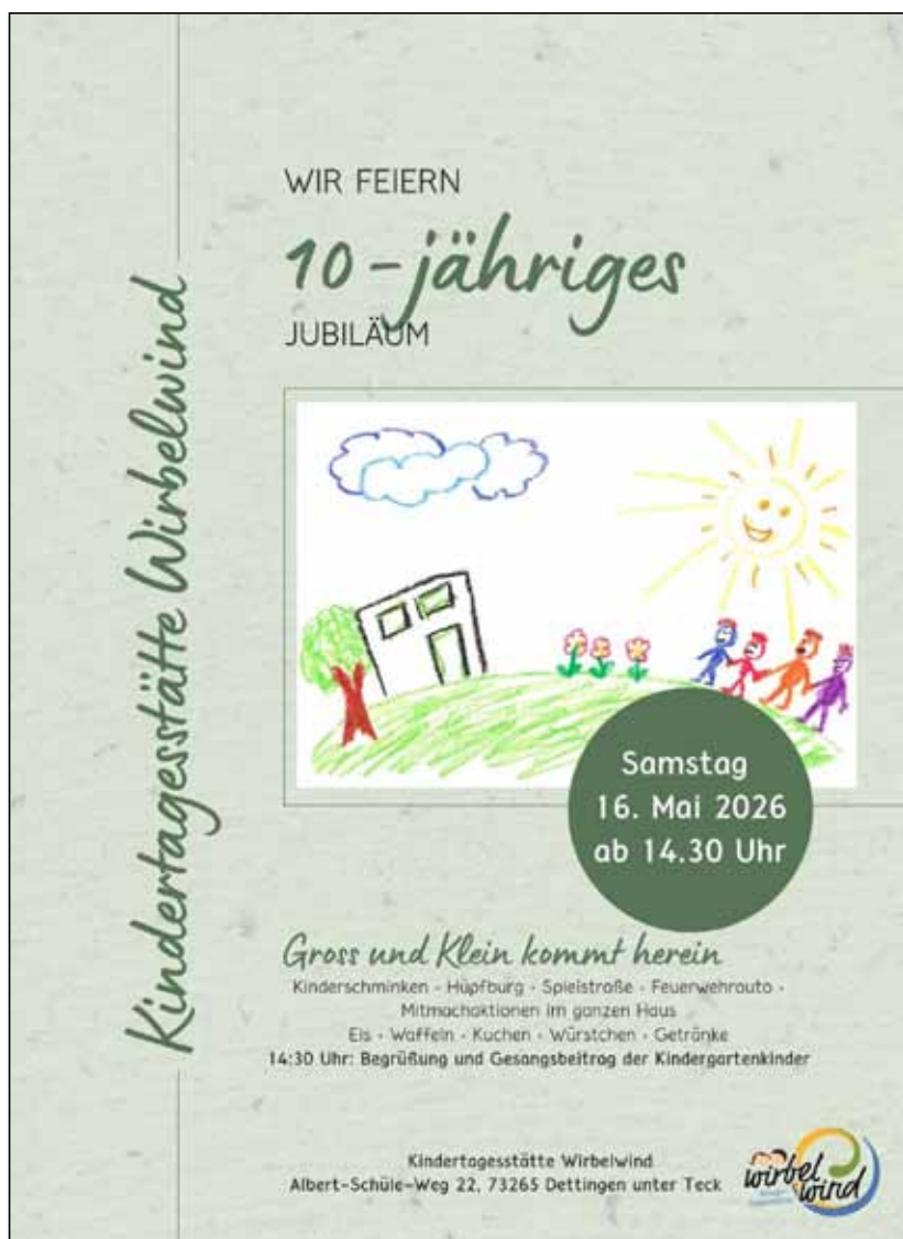
Plakat: Kindertagesstätte Wirbelwind

Ein Jubiläum voller Energie, Farben und Kinderlachen!