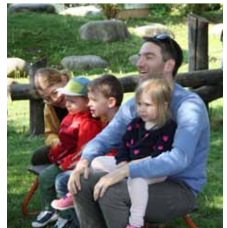
Groß und Klein beim gemeinsamen Singen