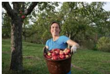
Geschmackliche Vielfalt: Tafeläpfel von der Streuobstwiese

Aktuelle Informationen finden Sie auf www.handelsplattform-streuobst.de . Dort können sich Erzeuger*innen direkt registrieren. Interessierte Einzelhändler*innen, Kantinen oder Bäckereien können sich direkt an die Geschäftsstelle des Schwäbischen Streuobstparadieses in Bad Urach wenden.