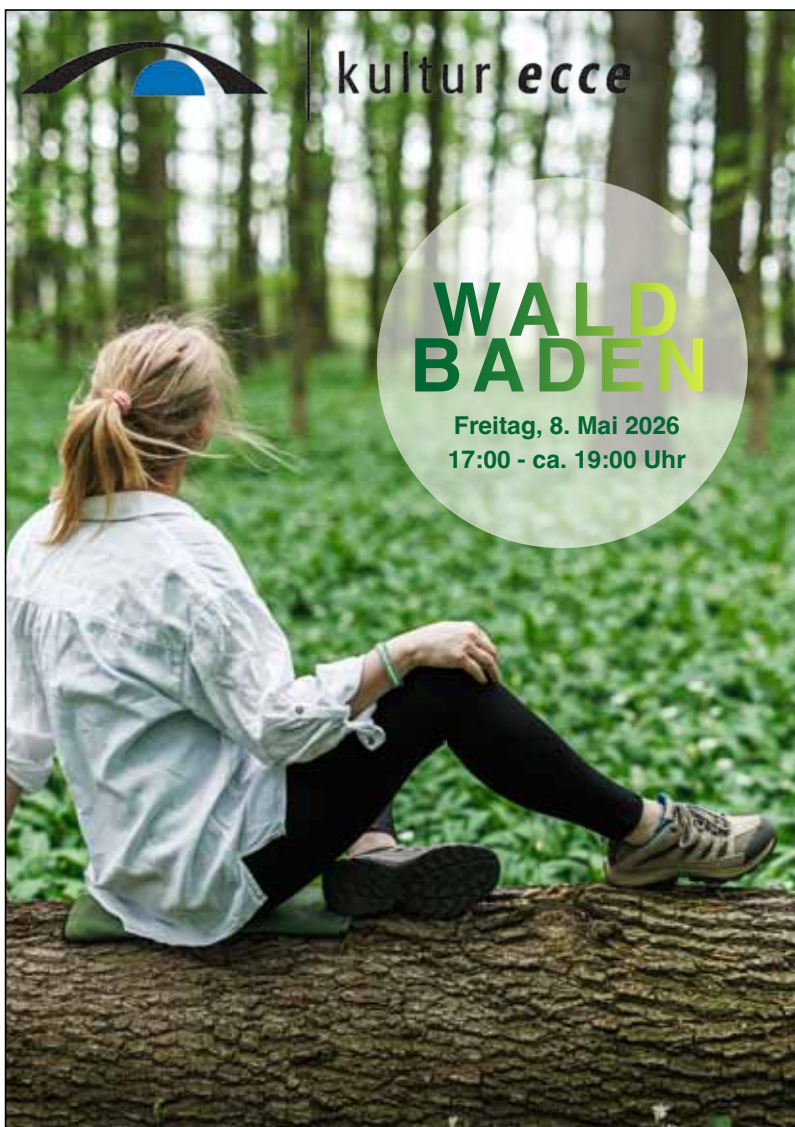
Plakat: K. Prinz