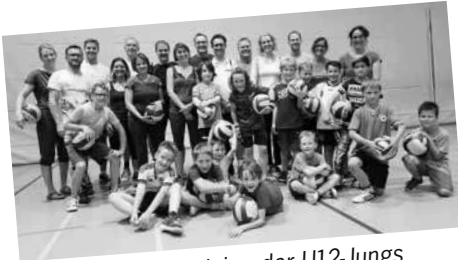
Gemeinsames Training der U12-Jungs mit ihren Eltern