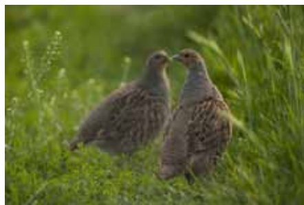
Das Rebhuhn ist der Vogel des Jahres 2026

bische Alb mit ihren Rangerinnen und Rangern im Februar und März 2026 ein Rebhuhn-Monitoring.