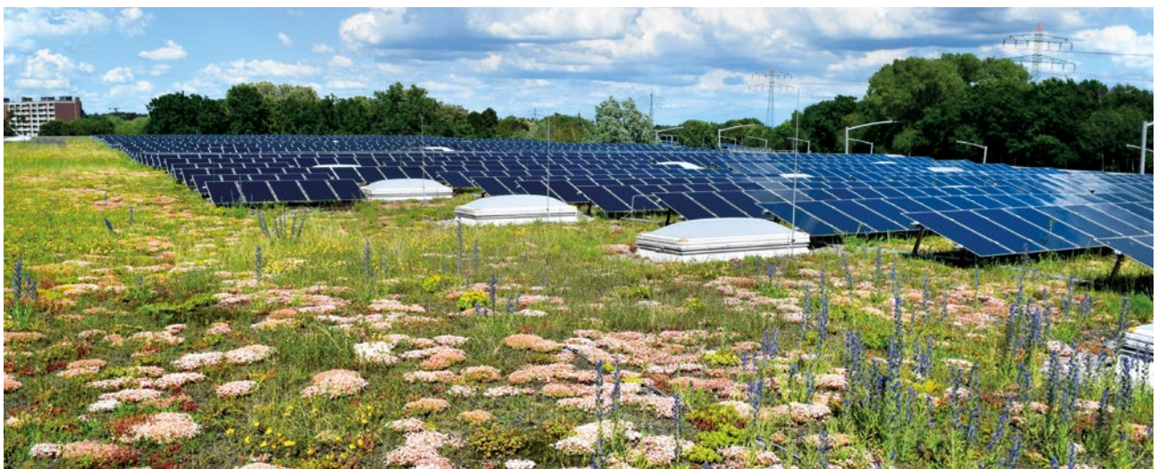
Abbildung 2: Da freut sich Biene und Co – Artenvielfalt auf einem Solar-Gründach.